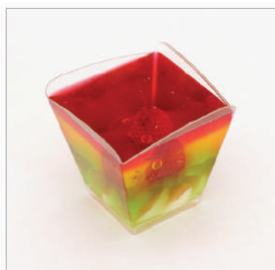
4. Mini galaretka