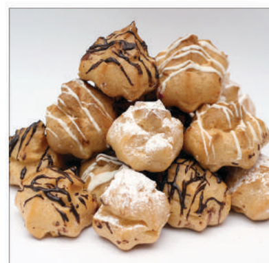
6. Mini ptysie