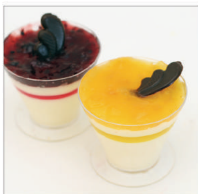
1, 2 Pana cotta